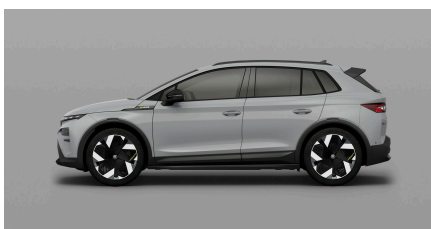
Sivá Steel, uni