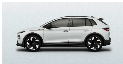
Biela Moon, metalická