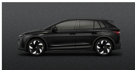
Čierna Magic, metalická