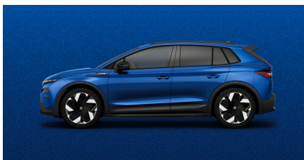
Modrá Race, metalická