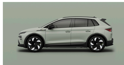
Zelená Timiano, uni