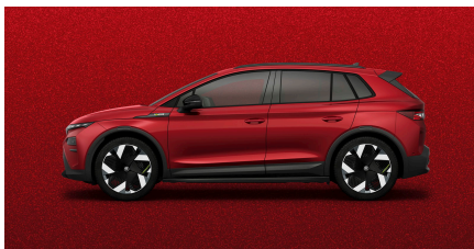
Červená Velvet, metalická