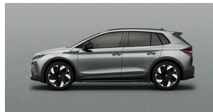
Strieborná Smokey Diamond, metalická