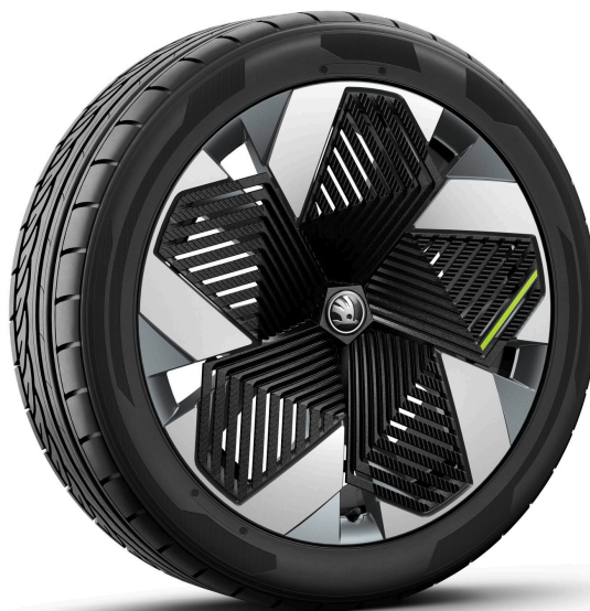
Vision 21" antracitové