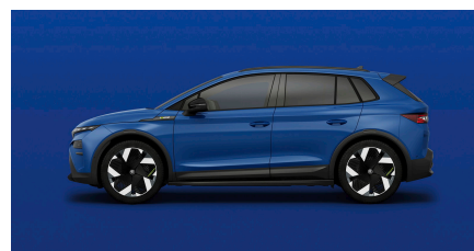
Modrá Energy, uni