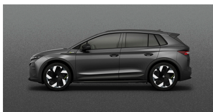
Sivá Graphite, metalická