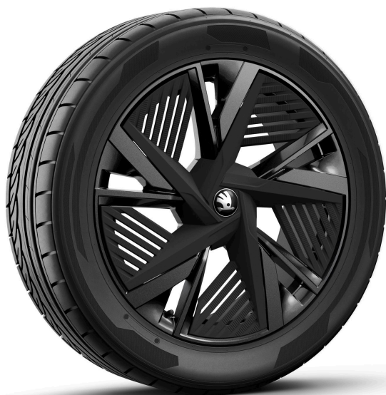
Draconis 20" čierne