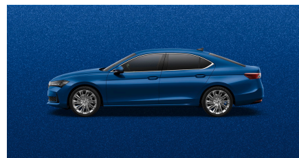
Modrá Cobalt, metalická