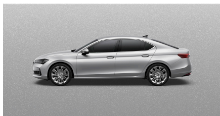
Strieborná Pebble, metalická