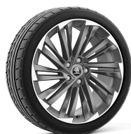
Veritate 19" antracitové leštené