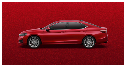
Červená Carmine, metalická