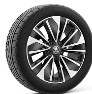
Alkaris 17" čierne leštené