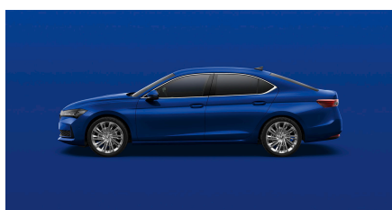
Modrá Energy, uni