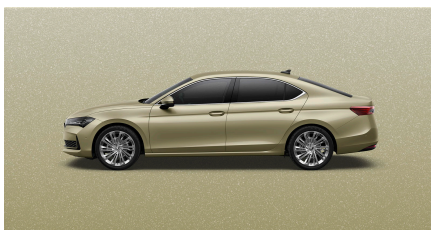
Žltá Ice Tea, metalická