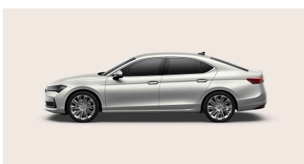
Biela Purity, uni