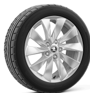
Mintaka 17" striebové