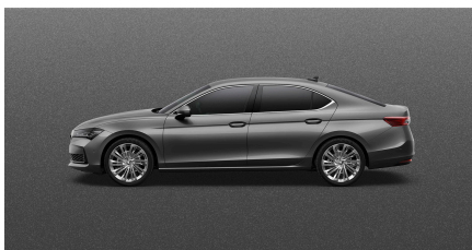
Sivá Graphite, metalická