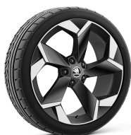
Torcular 19" čierne leštené