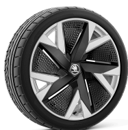
Aniara 19" striebové s aero krytmi