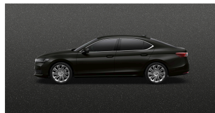
Čierna Ebony, metalická