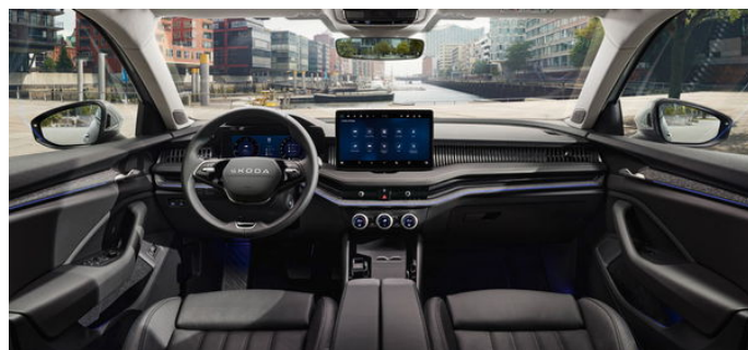
Suite v čiernej farbe