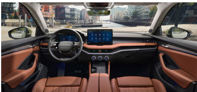
Suite vo farbe Cognac