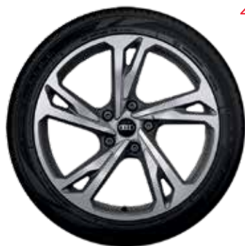
42 5-dvojitých lúčov-dizajn