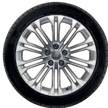
17 10-parallelných lúčov-dizajn