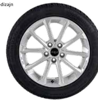
77 AZW Diamant