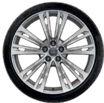
36 10-paralelných lúčov-dizajn