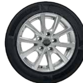
76 AZW Peak