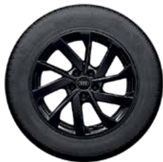
2 10-lúčový Turbinen-dizajn