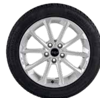
77 AZW Diamant