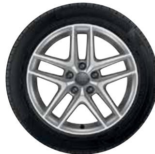
14 5-paralelných lúčov-V-dizajn