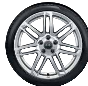
74 7-dvojitých lúčov-dizajn