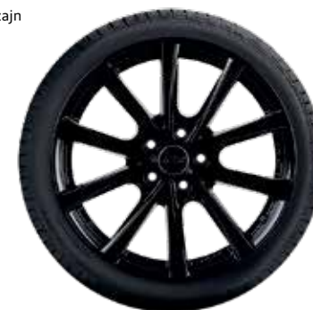
78 AZW Peak