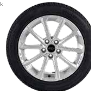
77 AZW Diamant