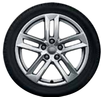
10 5-paralelných lúčov-dizajn