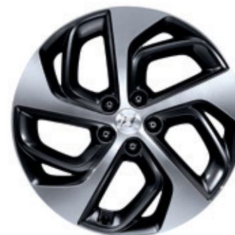
19-palcové zliatinové disky