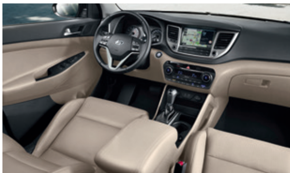
Běžová koža + čierny dvojfarebný interiér