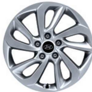
17-palcové zliatinové disky