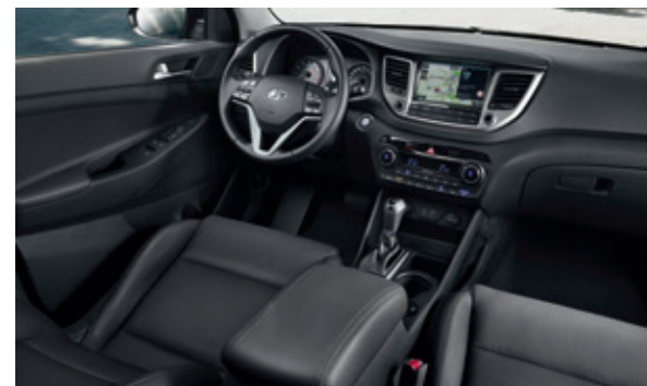
Čierna koža + jednofarebný interiér (k dispozícii aj v látke)