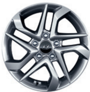
16-palcové zliatinové disky