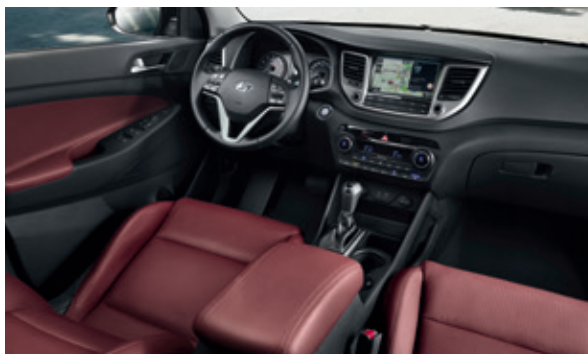
Vínovočervená koža + čierny dvojfarebný interiér